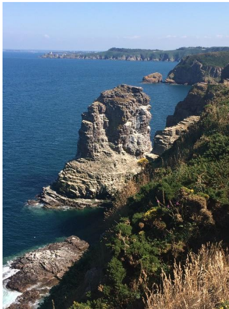
Das Cap Fréhel

Wir sind 8 Tage lang unterwegs und starten an einem Freitagabend, übernachten im Bus und kommen dann bei günstiger Verkehrslage nachmittags in Saint-Brieuc an. Den Rest des Wochenendes verbringen dann alle in ihren Gastfamilien . Von Montag bis Donnerstag durchlaufen wir dann ein abwechslungsreiches Programm zwischen dem Kennenlernen des französischen Schulalltags und schöner Sehenswürdigkeiten der näheren und auch etwas weiteren Umgebung, z. B. das Cap Fréhel oder der weltberühmte Mont Saint-Michel.